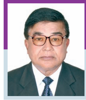
केदारमान कर्माचार्य संचालक